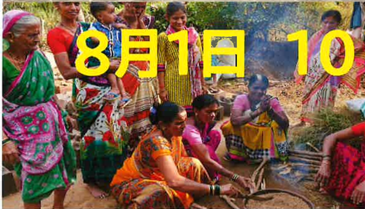
ベトナム・ナシケラブ